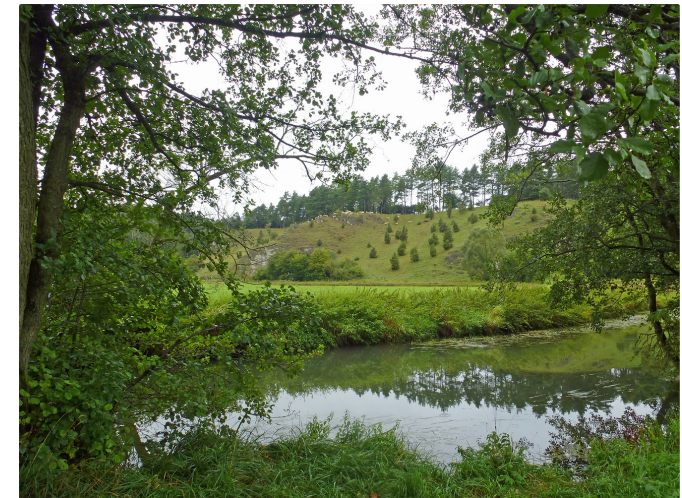
Schwarze Laber

Genießen Sie die einfach die einzigartige Juralandschaft entlang der bunten Talhänge, bis es dann auf einem befestigten Weg in den Ort hineingeht.