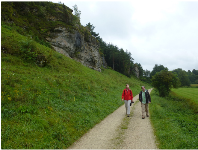
Felsen im Tal der Schwarzen Laber

Das M -Zeichen, an einer Holzscheune angebracht, leitet uns links hinein in die 30er-Zone. Im Rechtsbogen der Polstermühlstraße, die kath. Dorfkirche St. Martin schon vor uns sichtbar, geht es vor dem alten Gasthof scharf nach links und im Gastelhofer Weg jetzt abwärts Richtung Eichenhofen ( km 6,5 ).