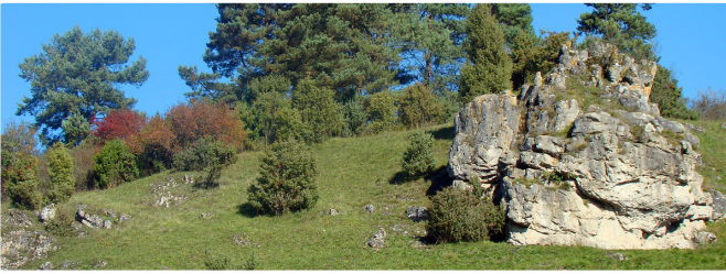
Felskulisse im Labertal