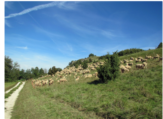
Schafe am Wegrand

Von Nürnberg oder Neumarkt i. d. Opf. aus bringen uns die Regionalzüge R schnell und bequem nach Parsberg, dem südöstlichsten Bahnhof im Verbundgebiet. Nach dem malerischen Tal der Schwarzen Laber – flankiert von den für den Oberpfälzer Jura typischen schroffen, weißen Jurafelsen – dann der krasse Gegensatz: Der Anstieg zur Ruine Adelburg, deren Geschichte immer noch einige Rätsel aufgibt.