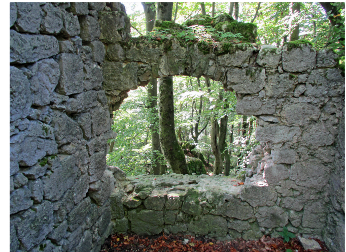
Ruine Adelburg

Nicht so der schöne Wanderpfad entlang des Burgfelsens: Nach einer gemütlichen Einkehr in Hollerstetten ist der Weg nach Batzhausen mit schönen Blicken auf die hügelige Juralandschaft gleich geschafft. Mit den farbenfrohen agilis -Fahrzeugen ist man in nur 14 Minuten wieder in Neumarkt, mit R- oder S-Bahn dann schnell im Ballungsraum.