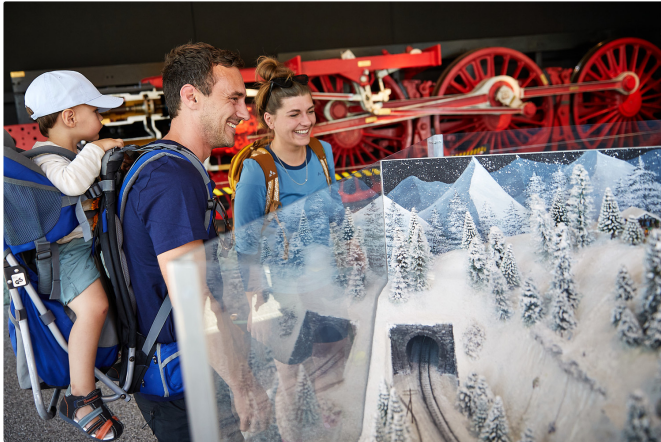
Familientour mit dem VGN ins Deutsche Dampflokmuseum (23.06.2023,)

Mit Markierung (WZ SE fehlt) wandern wir über einen Waldpfad zum Steigungsanzeiger, um in das Eisenbahnerdorf Neuenmarkt zu kommen. Hier führt der Weg durch den Ort und vor der Eisenbahnbrücke rechts zum Deutschen Dampflokmuseum . Wer möchte, kann vorher noch einen Abstecher zur Schlömener Kurve machen.