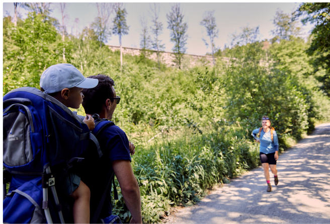
Eisenbahnerlebnis im Deutschen-Dampflokmuseum

Wir starten am Informationszentrum und wandern, mit dem Bahnhofsgebäude zur Linken, am Gasthof-Hotel „Regina“ vorbei, in die Bernecker Straße. Den Markierungen SE und ◀ folgend, geht es neben der Kirche links in den Wiesenpfad zur Station Zugbahnfunkmast und hinüber zur Straße sowie bergab zur Infotafel Rückdrückgleis. Dort erhalten wir eine Info zum trickreichen Überholen langsamer Züge auf steiler Strecke.