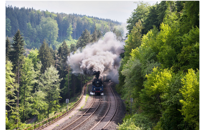
Dampflokenerlebnis mit dem VGN

Weiter geht es zur Signal-Station und zur Aussichtsplattform Raue Mauer, eine aus Felsblöcken gebaute Überbrückung dreier Seitentäler. An den optischen Telegrafen können wir selbst Signale senden.