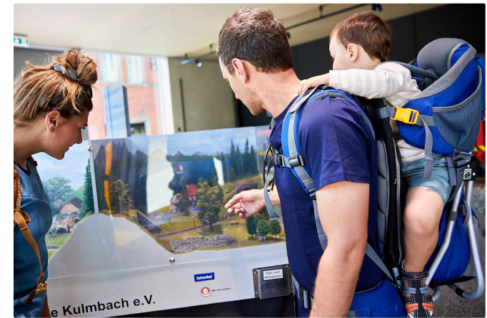
Eisenbahnerlebnis im Deutschen-Dampflok-Museum