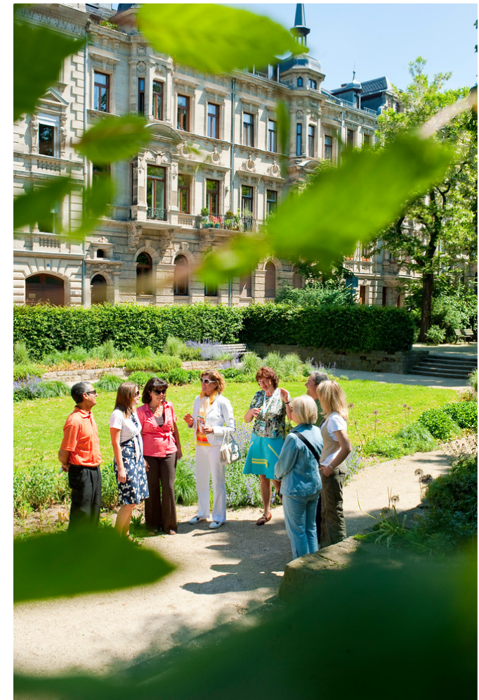
Stadtführung Hornschuchpromenade

Wollen Sie mehr kulturelle Informationen zu den Fürther Sehenswürdigkeiten und zur jüdischen Geschichte? Dann lassen Sie sich von unserem Handy guide führen: m.fuerth.tomis.mobi