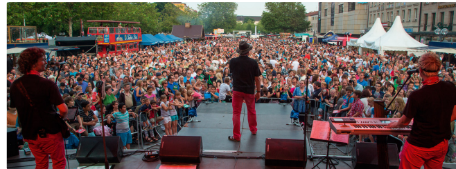
Fürth Festival (05.07.2013,)