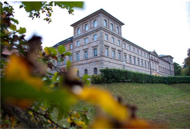
Schloss Burgfarrnbach (Erich Malter © Erich Malter)