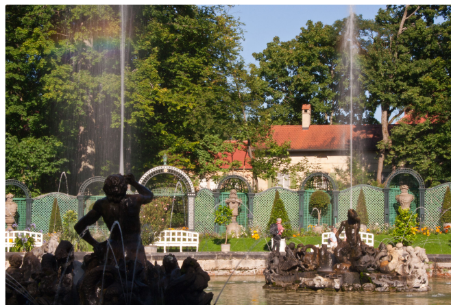
Eremitage (20.08.2010,)

Doch erst die Wasserspiele machen das Gesamtkunstwerk vollkommen. Die Wasserspeier, Fontänen und Spiegelwasser der Putten, Delfine, Seepferdchen und Nymphenfiguren werden noch heute mit Wasser aus dem etwas höher gelegenen Turm betrieben.