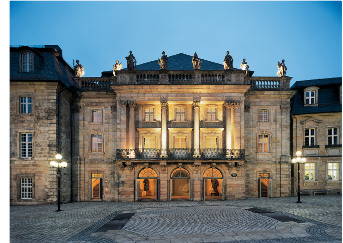
Markgräfliches Opernhaus Bayreuth (24.04.2018,)

Jahrhunderts sowie als eines der schönsten Barocktheater Europas und zeugt noch heute vom Leben und Wirken sowie den künstlerischen Neigungen der Markgräfin Wilhelmine. In nur vier Jahren Bauzeit wurde es 1748 fertig gestellt. 2012 begannen die umfangreichen und mehrjährigen Sanierungsarbeiten, welche bis April 2018 andauerten. Nun ist es aber wieder für den Publikumsverkehr eröffnet und präsentiert sich in voller Pracht. Nach der Wiedereröffnung soll es nicht nur als Museum dienen, sondern von Mai bis Oktober vor allem auch wieder bespielt werden.