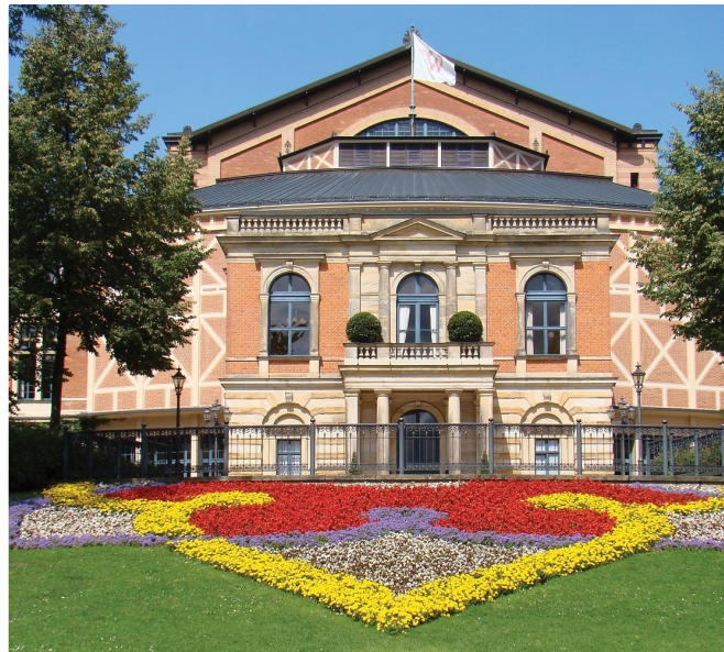
Festspielhaus Bayreuth (VGN © VGN GmbH 2010)

Im Sommer 1876 gingen die ersten Festspiele über die Bühne. Jeder, der im Deutschen Reich Rang und Namen hatte, reiste damals nach Bayreuth. Selbst der brasilianische Kaiser Dom Pedro II. ließ es sich nicht nehmen, die Uraufführung des Werkes „Der Ring des Nibelungen“ zu besuchen. Wagner konnte mit Recht behaupten: „Ich bin der Erste, wo der Fürst zum Künstler kommt und nicht umgekehrt.“