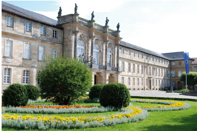
Neues Schloss mit Staatsgemäldesammlung und Archäologisches Museum – 1753 erbaut

Sehenswert sind auch die Sammlung Bayreuther Fayencen, das Markgräfin-Wilhelmine-Museum und die Bayerische Staatsgemäldesammlung.