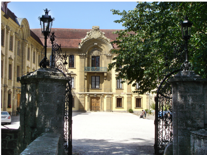
Schillingsfürst (20.02.2019,)

Am Wall 14 91583 Schillingsfürst Tel: 09868 201 E-Mail: office@schloss-schillingsfuerst.de www.falkenhof-schillingsfuerst.de