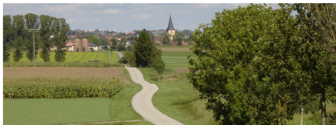
Vor Gebsattel (20.02.2019,)

Dort halten wir uns nach links und gelangen über die Neumühle nach Bellershausen , wo wir wieder auf unsere Ausgangsbeschilderung „Romantische Straße“ treffen. Dieser folgen wir nun über die Rothenburger Straße, unterqueren die Talbrücke der A7 und erreichen Diebach . Wir radeln entlang der Hauptstraße durch den Ort. An der Einmündung in die Bockenheimer Straße fahren wir nach rechts und weiter am Ortsende links ab zur Tauber. Hier gelangen wir wieder auf den Radweg „Alte Bahnlinie“, dem wir wie beschrieben nach Rothenburg folgen.